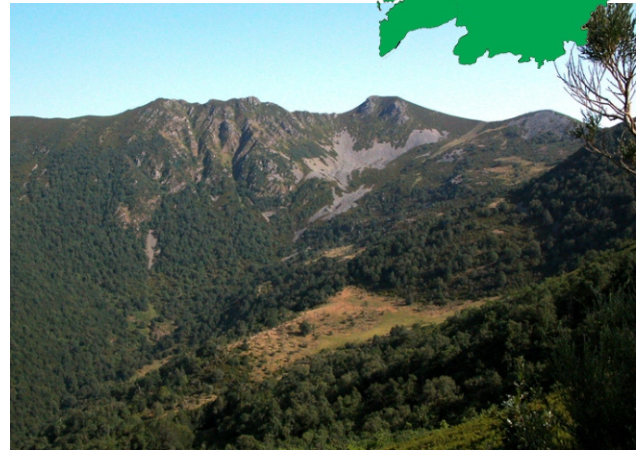
Circo glaciar de Tres Bispos