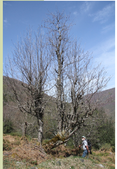
Capudre ( Sorbus aucuparia )