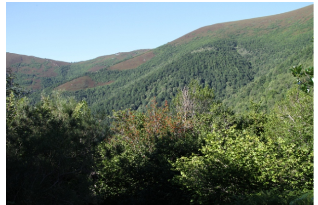
Fragas no val do Ortigal

Un percorrido seguindo o curso do río Ortigal para achegarse ao circo glaciar de Tres Bispos, coa posibilidade de subir ata o cume. Podemos gozar de boas vistas do val e das fragas nas abas da Serra de Villous. A ruta discorre, en parte, polo Abesedo de Donís, unha das mellores fragas dos Ancares. Se facemos a ruta a mediados de abril podemos gozar dun espectáculo pouco común, a floración dos narcisos no Campo Formoso.