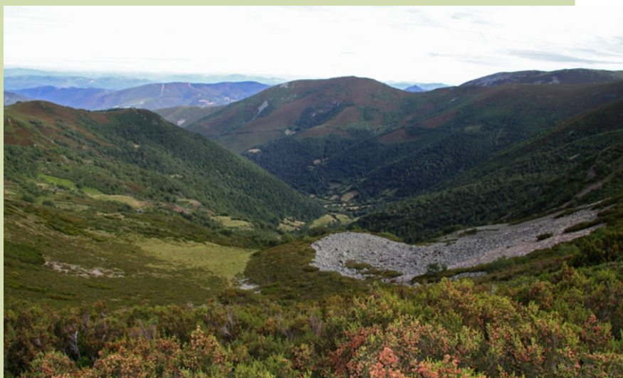
Vista do val do Ortigal desde as abas de Tres Bispos

Na estrada de Campa da Braña a Piornedo, na ponte de Vales arranca o camiño que remata nunha campa debaixo dos cumes de Tres Bispos e Os Penedois. Desde este lugar pódese subir á campa de Tres Bispos e seguir ata o cume.