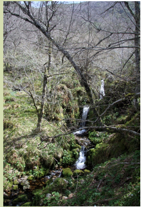
Unha das moitas fervezas do río Ortigal