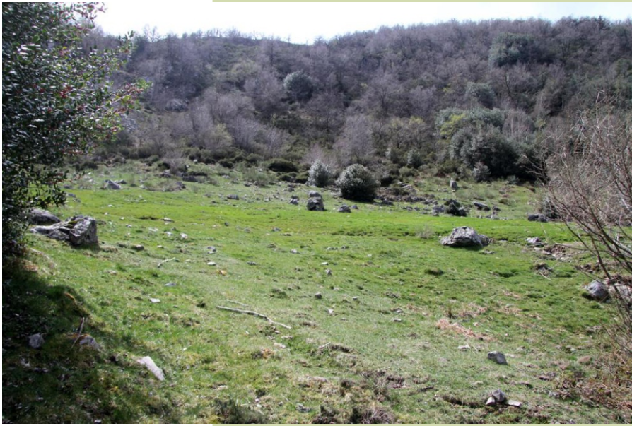
Vestíxios da actividade glaciaria na parte alta do val do río Ortigal