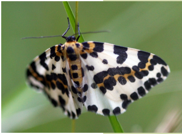
Bolboreta ( Abraxas grossulariata )

As tres especies de narcisos que podemos atopar no val do Ortigal