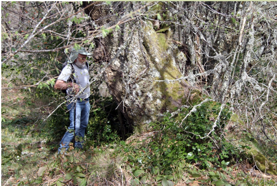
Tres bidueiros de grande porte nas beiras do río Ortigal