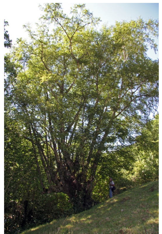
Carba ( Quercus petraea ).