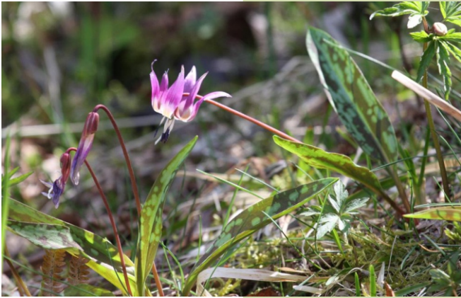
Dente de can ( Erythronium dens-canis )