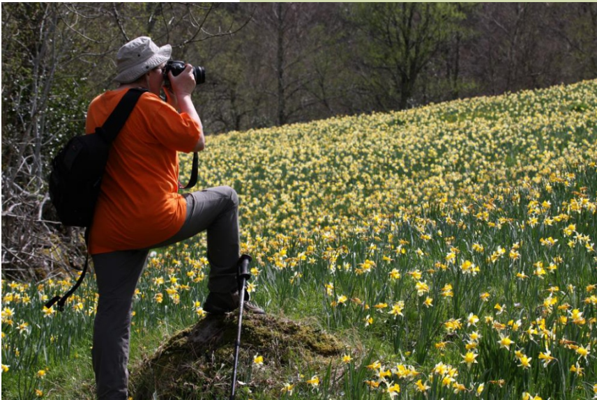
Floración de narcisos no Campo Formoso